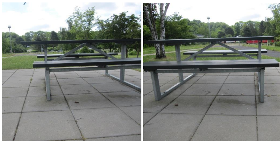
Bord/bænkesættet på rasteplassen Antvorskov Nord.

bord/bænkesættet. Selve bord/bænkesættet er konstrueret således, at en kørestolsbruger kan sidde for enden af bordet i den ene side. Bordpladsens kant går på den ene side 14,5 cm ud, og på den anden side, hvor kørestolsbrugeren kan placere sig, går bordpladsen 33 cm ud. Selve bordet er 72 cm højt. Der er 1,5 m vendeplads bag den plads, der er beregnet til kørestolsbrugere. Fliserne omkring spisepladsen er lagt således, at det kun er muligt for en kørestolsbruger at sidde i den ene ende, da der ved den anden ende af bordet ikke er tilstrækkelig plads.