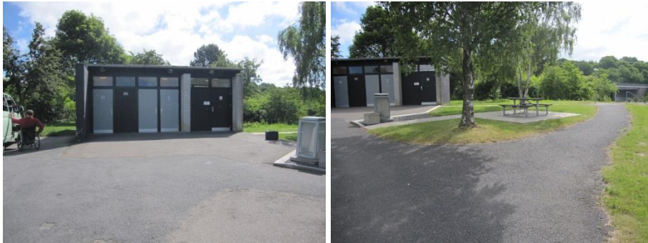
Rastepladsen Antvorskov Nord.