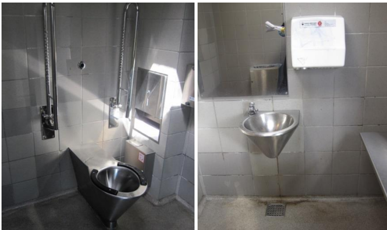
Handicaptoliet, Rønninge Nord.

Det er ikke muligt at benytte håndvasken, når man sidder på toilettet. Der er desuden ikke tilstrækkelig vendeplads (minimum 1,5 m) på toilettet. Denne plads kunne dog findes, hvis det fastmonterede puslebord kunne slås op. Armaturet på vasken betjenes, ved at man trykker meget hårdt ned på en knap, hvilket ikke er muligt for personer med nedsat kraft i arme og hænder. Vandtrykket i hanen er meget kraftigt, og da besøgsholdet testede vandhanen, resulterede dette i, at vandet sprøjtede op.