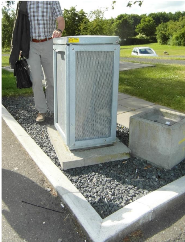
Skraldespand ved spiseplads på rasteplassen Antvorskov Nord.

Besøgsholdet anbefalede under inspektionen, at skraldespanden blev placeret mere tilgængeligt, og at Vejdirektoratet i øvrigt overvejede, om denne type skraldespand er velegnet til dette formål.