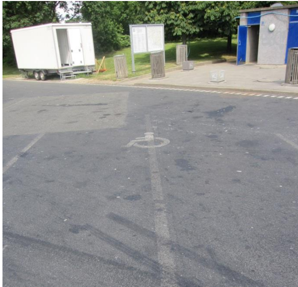
Handicapparkeringsplads Rønninge Nord.

Besøgsholdet anbefalede under inspektionen, at der blev lavet en klar markering af handicapparkeringspladsen, da denne med den nuværende manglende markering let kan overses af andre bilister. Desuden anbefalede besøgs holdet, at der blev opsat et skilt ved handicapparkeringspladsen med angivelse af, at parkeringspladsen er reserveret til biler med handicapparkeringsskilt.