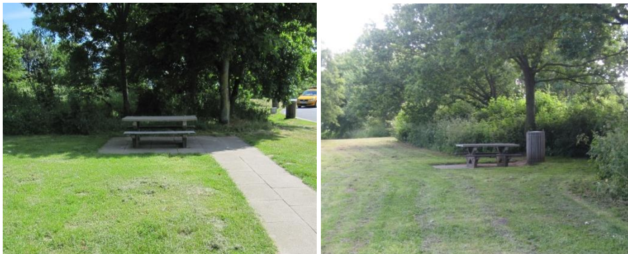
Spisepladser på rastepladsen Rønninge Nord.

Til højre for toiletbygningen er placeret et bord/bænkesæt. En flisesti leder ned til spisepladsen. Repræsentanter for Vejdirektoratet oplyste under inspektionen, at bord/bænkesættet stammer fra rastepladsens etablering i 1970'erne. Selve bordet er 70 cm højt, og endestykket af bordpladen måler 25 cm i begge ender. Fliserne omkring spisepladsen er lagt således, at der kun er vendeplads ved den ene ende af bordet. Desuden vil en kørestolsbruger kun kunne benytte bordet ved at sidde med siden til på grund af manglende benplads.