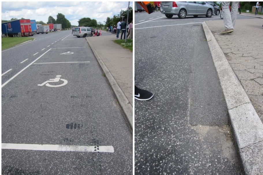
Handicapparkering på rasteplassen Nørremark

Jeg har noteret mig det oplyste og foretager mig ikke mere i den anledning.