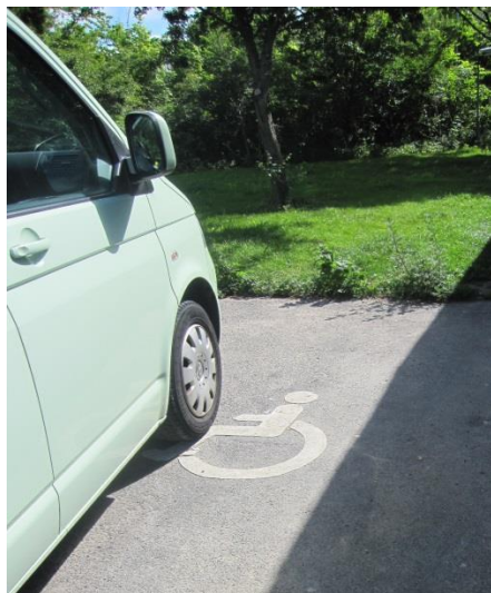
Handicapparkeringsplads på rasteplassen Antvorskov Nord.

ringspladser for almindelige personbiler. Belægningen er af asfalt. På asfalten er malet et handicappiktogram. Der er intet skilt ved parkeringspladsen, der angiver, at der er tale om en handicapparkeringsplads.