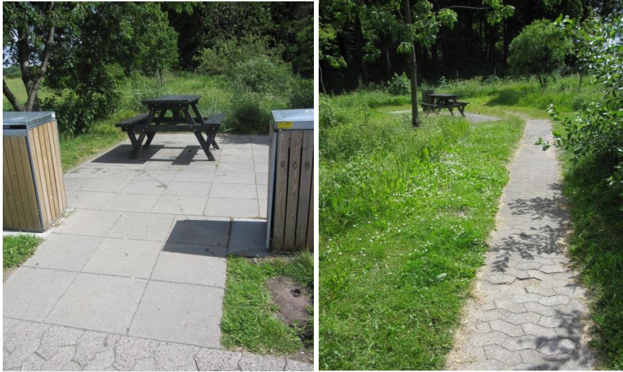
Spiseplads på rasteplassen Nørremark.

Spisepladserne langs fortovet har et underlag af forholdsvis nyanlagte fliser, og der er plads i den ene ende til, at der kan være en kørestol, og at denne efterfølgende kan vende.