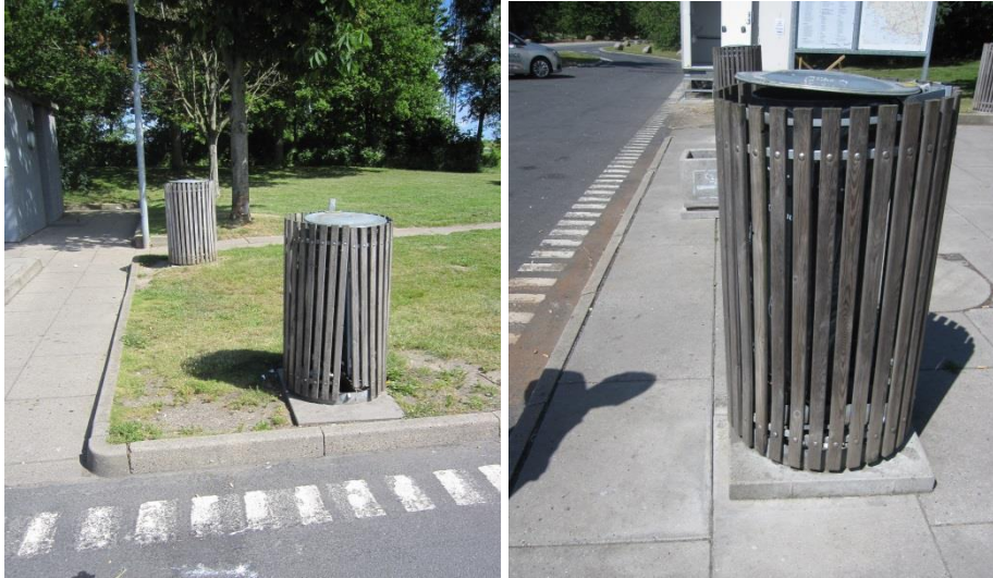
Skraldespande på rasteplassen Rønninge Nord.

Jeg har noteret mig det oplyste og foretager mig ikke mere i den anledning.