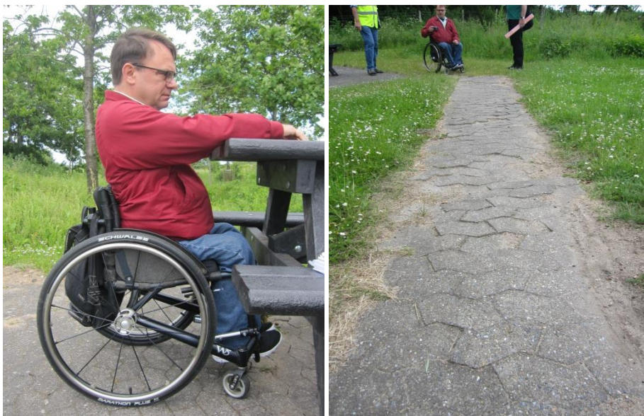
Højt bord/bænkesæt og sti til spiseplads, Nørremark.

Besøgsholdet opfordrede repræsentanterne for Vejdirektoratet til at vælge bord/bænkesæt, der er mere tilgængelige, når de eksisterende skal udskiftes.