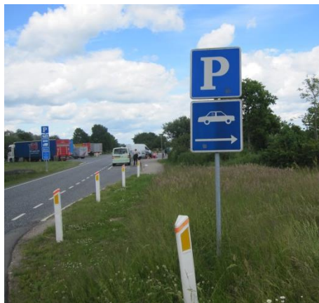
Parkeringskilte på rastepladsen Nørremark.

På afkørselsvejen fra motorvejen til rastepladsen er der placeret et skilt med angivelse af, at der er parkeringspladser, hvis man drejer til højre ned ad en mindre vej. Der er desuden parkering for personbiler, herunder handicapparkeringspladser, foran toiletbygningen og spisepladserne.