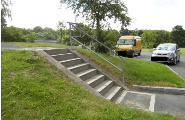
Trappe fra parkeringspladser til toiletbygning, Antvorskov Nord.

et gelænder placeret i højre side. Der er ingen taktil markering ved eller på selve trappen.