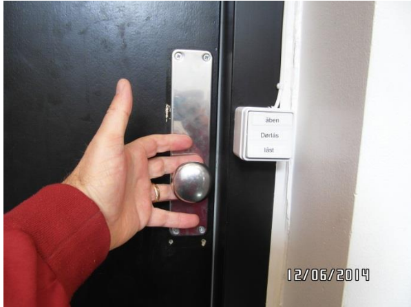
Indvendigt dørhåndtag og knap til aflåsning af handikaptoilet, Antvorskov Nord.

takten er anført teksten: åben – dørlås – låst. Der er ingen piktogrammer, der indikerer, hvad kontakten skal bruges til.