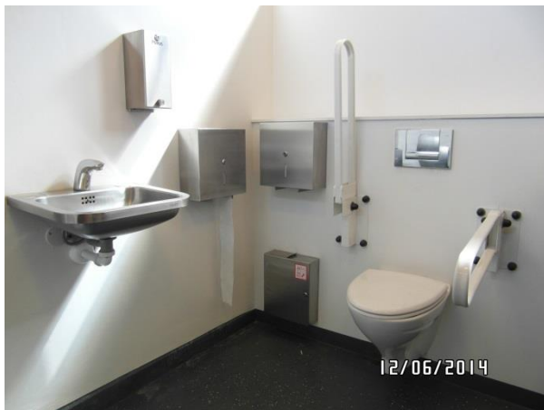
Handicaptollet på rasteplassen Antvorskov Nord.

stol er forsynet med fodstøtter, at komme ind under vasken med fodstøtter og ben. Sæbedispenseren er placeret i en højde af 1,22 m og er, i kombination med at den er placeret i hjørnet, svært tilgængelig for en kørestolsbruger.