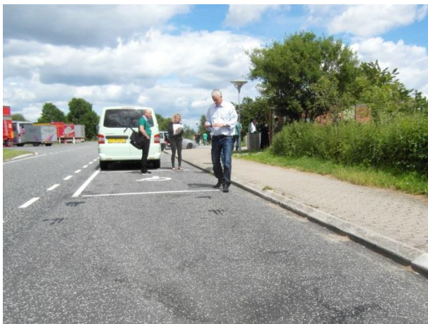
Umarkeret areal bag handicapparkeringspladserne på rasteplassen Nørremark.

Handicapparkeringspladserne er placeret parallelt med kantstenen i forlængelse af hinanden. Bag den bagerst placerede parkeringsplads er et umarkeret område.