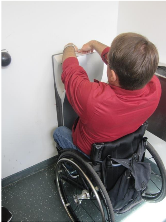
Håndtørrer på handiaptolletet, Antvorskov Nord.

Besøgsholdet anbefalede under inspektionen, at Vejdirektoratet foretog en gennemgang af toilettet med henblik på at gøre toilettet mere tilgængeligt (eventuelt med inspiration fra SBI's vejledning om offentligt tilgængelige WC-rum), herunder særligt med fokus på håndvasken og placeringen heraf, hånd-sæbedispenseren og håndtørreeren.