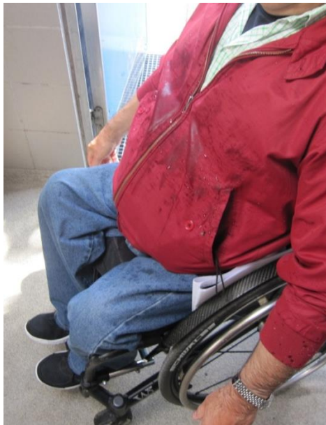
Vandsprøjt efter brug af håndvasken på handikaptoiletet, Rønninge Nord.

| Jeg har noteret mig det oplyste og foretager mig ikke mere i den anledning.