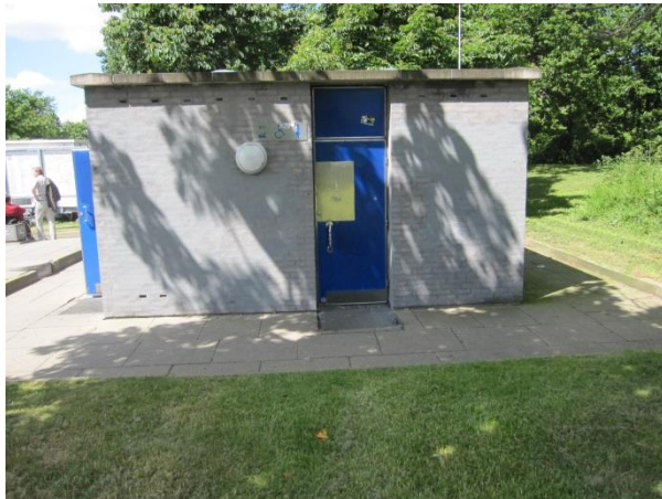
Rastepladsen Rønninge Nord.

Ombudsmanden modtog forud for besøget materiale om rastepladsen. Det fremgår heraf, at den (eller dele heraf) er renoveret inden for de seneste 4 år. Vejdirektoratet er ikke bekendt med dato for opførelse af bygningen. Der er efter det oplyste et handicaptoulet og en handicapparkeringsplads.