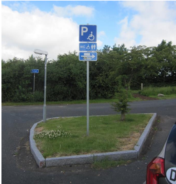
Skiltning på rasteplassen Antvorskov Nord.

Besøgsholdet bemærkede under inspektionen, at skiltningen kunne give anledning til forvirring. Placeringen af skiltet med angivelse af handicapparkering kunne foranledige folk til at tro, at den sidste parkeringsplads var reserveret til handicapparkering. Desuden kunne skiltet med teksten 'toilet' foranledige folk til at tro, at toiletfaciliteterne var bag skiltet og dermed inde på det grønne område. Besøgsholdet bad derfor Vejdirektoratet om at overveje en mere hensigtsmæssig placering af skiltene.