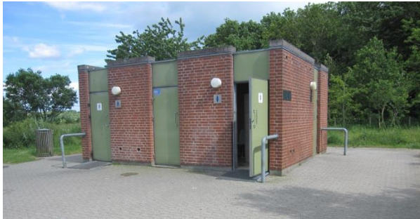
Toiletbygning på rastepladsen Nørremark.

Ombudsmanden modtog forud for besøget materiale om rastepladsen. Det fremgår heraf, at der er et handikaptoilet og to handicapparkeringspladser på rastepladsen. Vejdirektoratet er ikke bekendt med, hvornår toiletbygningen på rastepladsen er etableret, eller om der er foretaget eventuel renovering/ombygning.