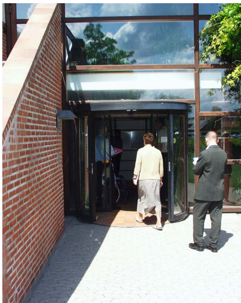
Illustration 2 Indgangen mod syd