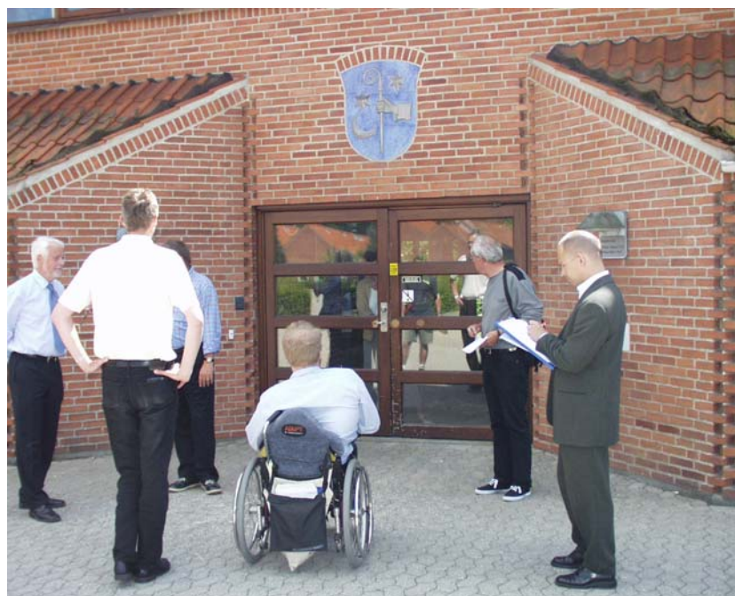
Illustration 5 Indgangen mod nord