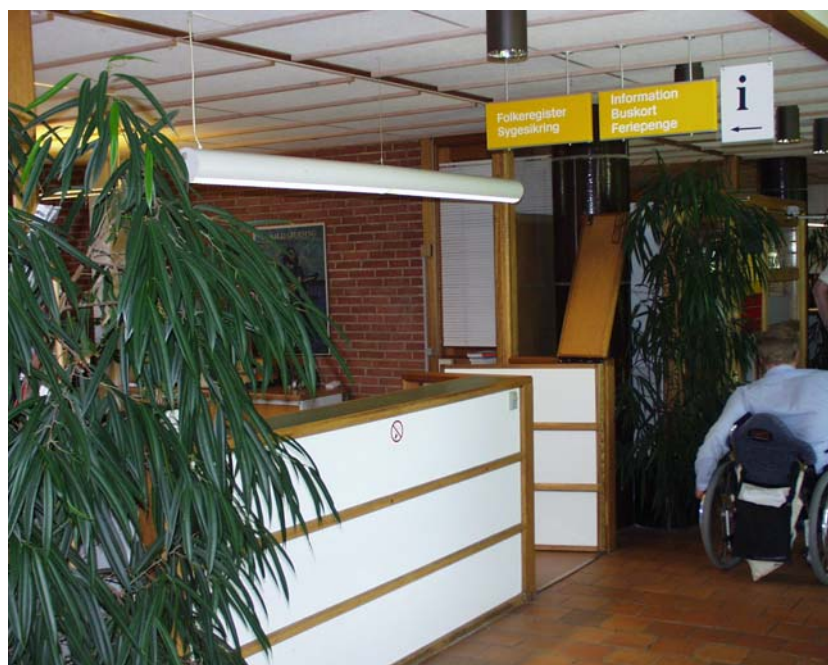
Illustration 6 Informationsskranke ved indgang