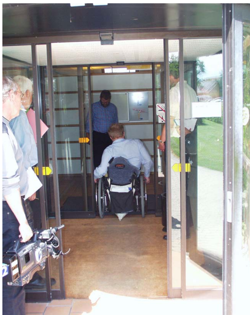
Illustration 3 Vindfang med kokosmåtte