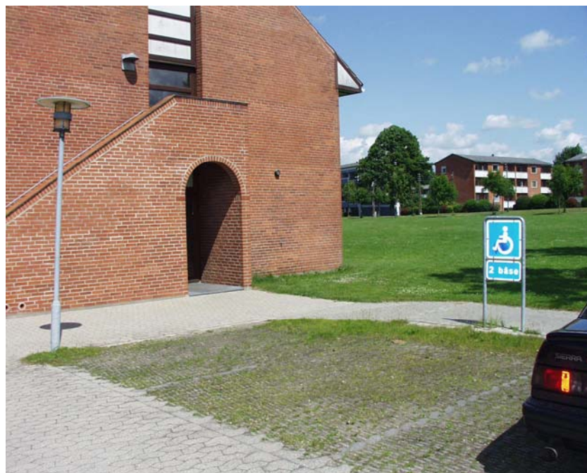
Illustration 1 Parkeringspladsen mod syd