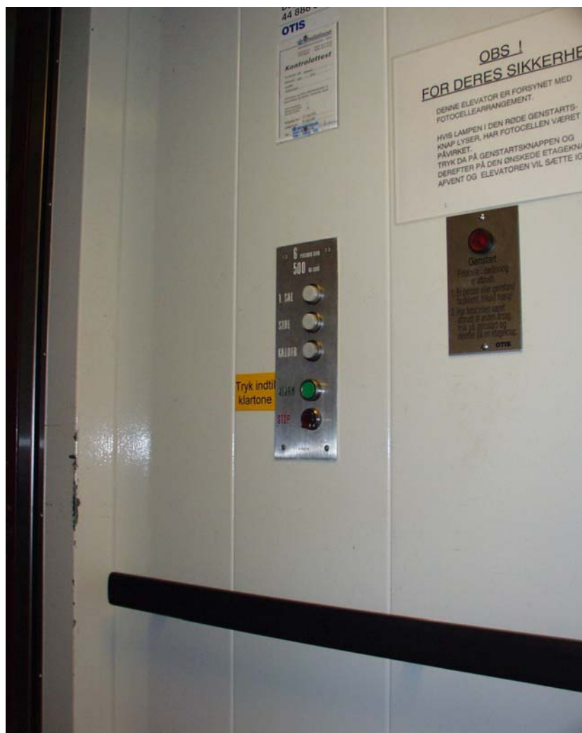
Illustration 7 Elevator – indvendige knapper