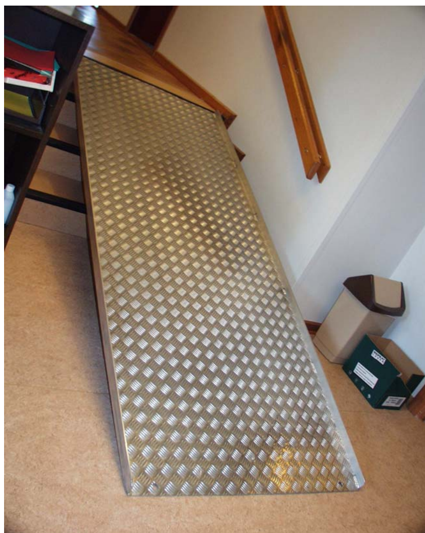
Illustration 9 Rampe til byrådssal