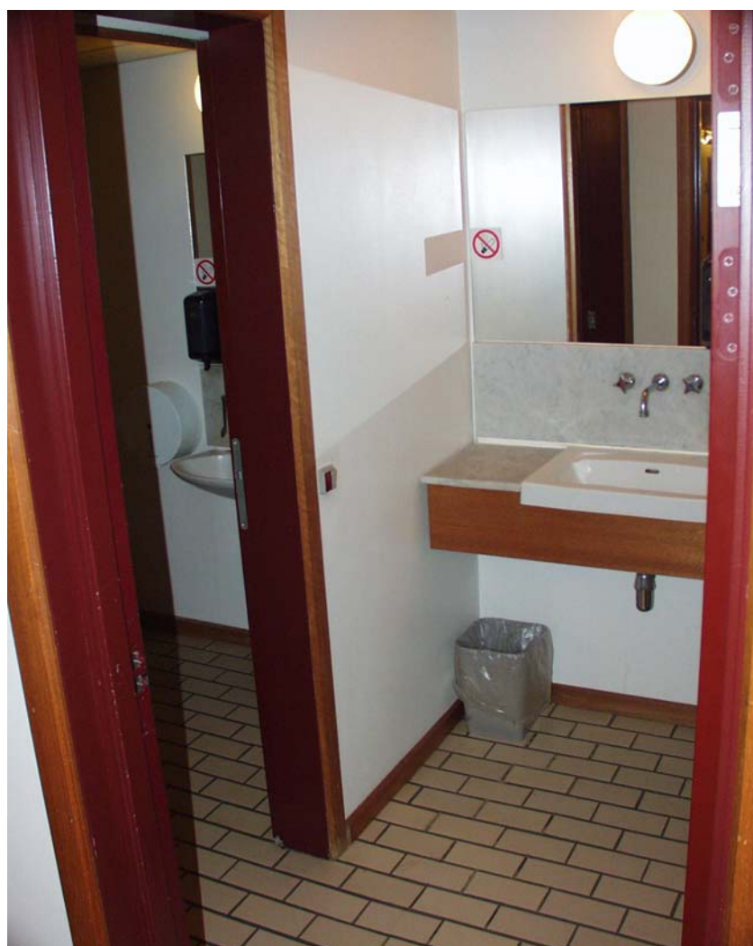
Illustration 8 Handicaptoilet i stuen