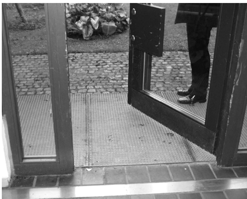
Illustration 4 Udgang til gårdhave