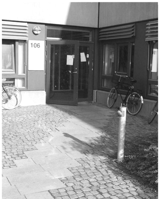
Illustration 13 Indgang 106