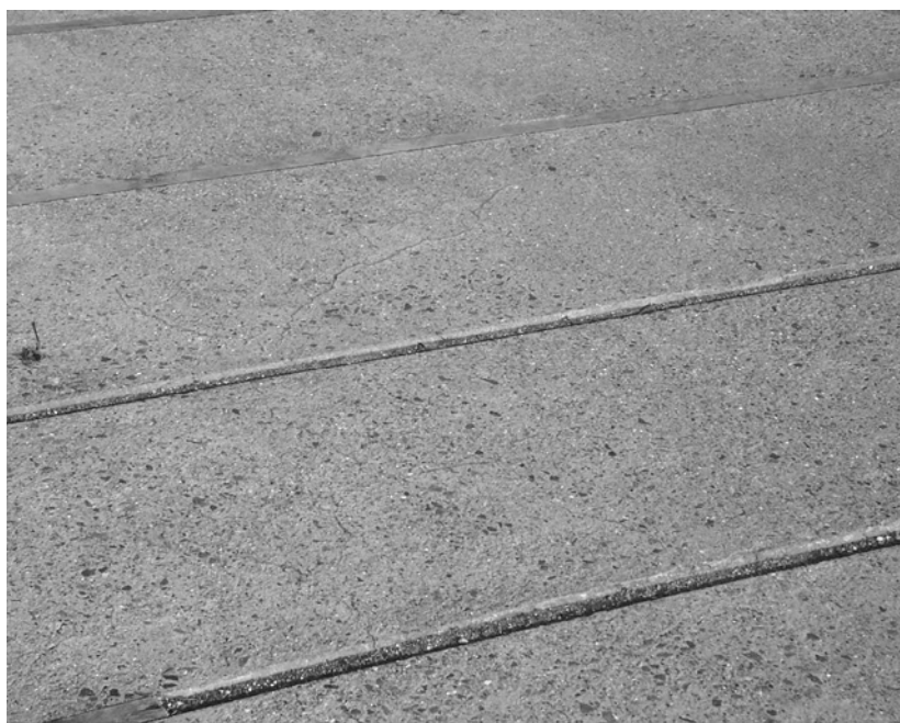
Illustration 14 Støbt betonareal med riller