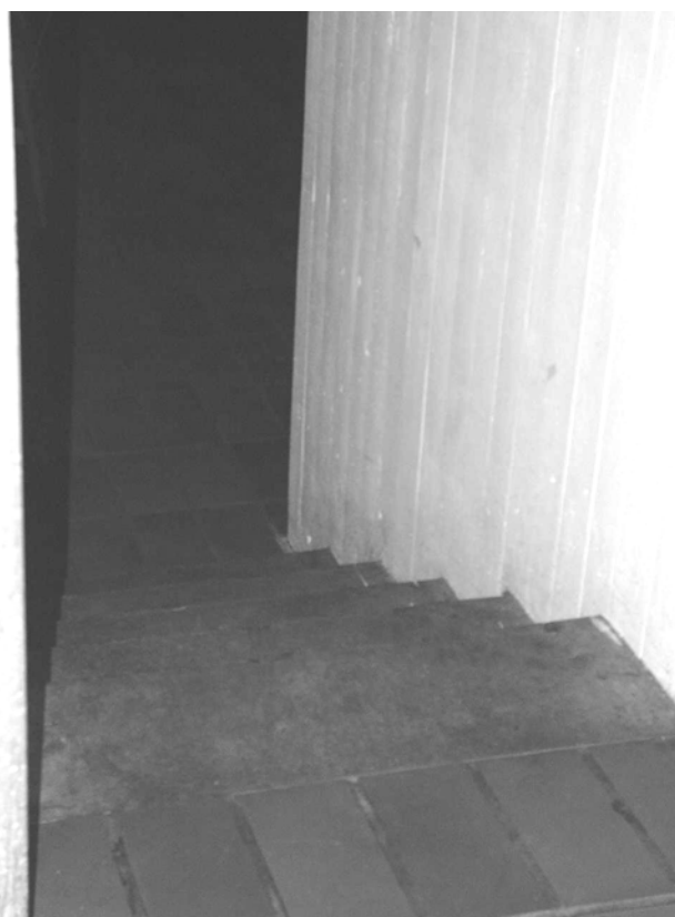
Illustration 8 Trappe til Mødestedet