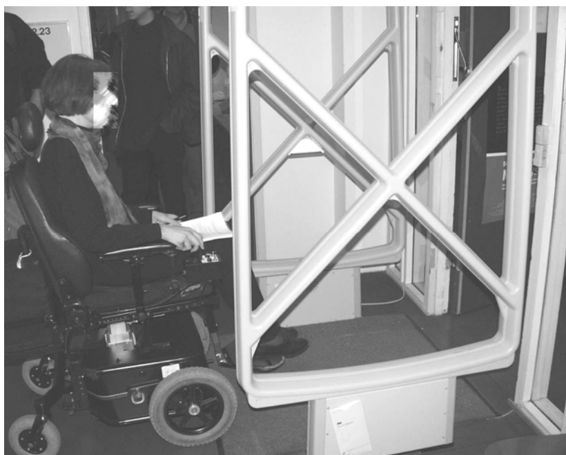
Illustration 21 Institutbibliotek på Institut for Nordisk Filologi