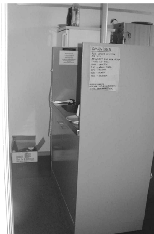
Illustration 22 Ombygget opholdskrog med halveret tekøkkenmodul