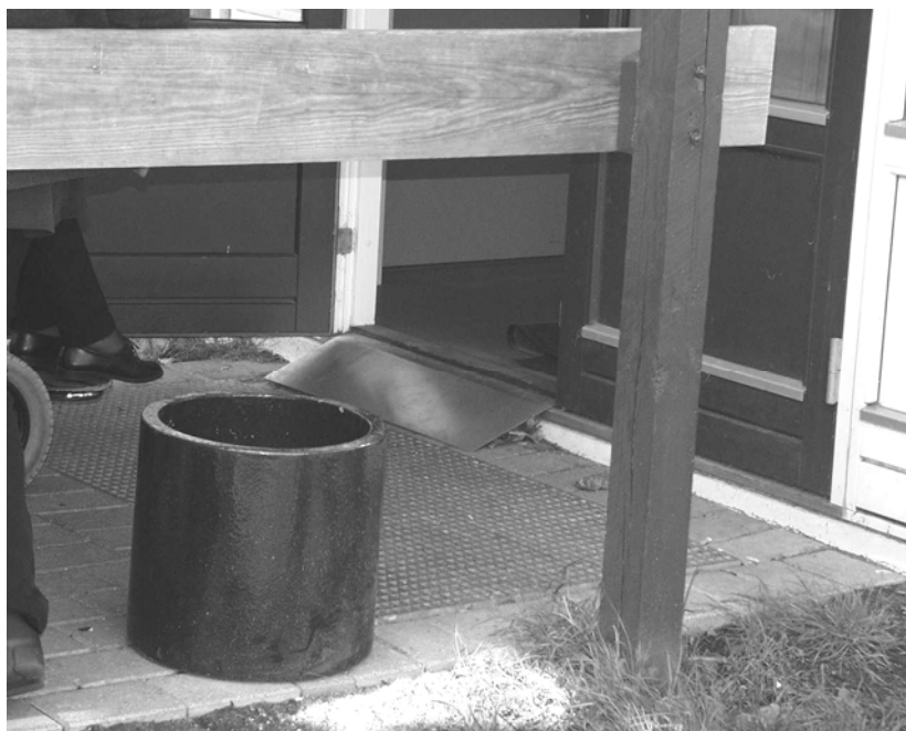
Illustration 16 Rampe ved pavillon P1-2