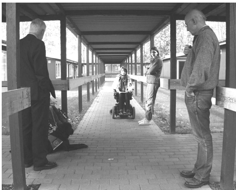
Illustration 15 Sti til pavilloner