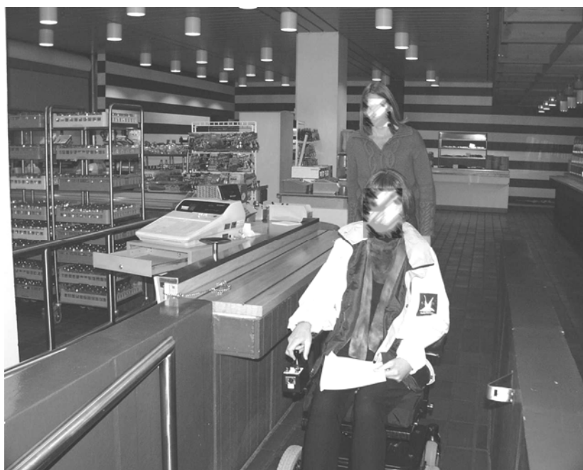
Illustration 18 Kasse i Danskantinen