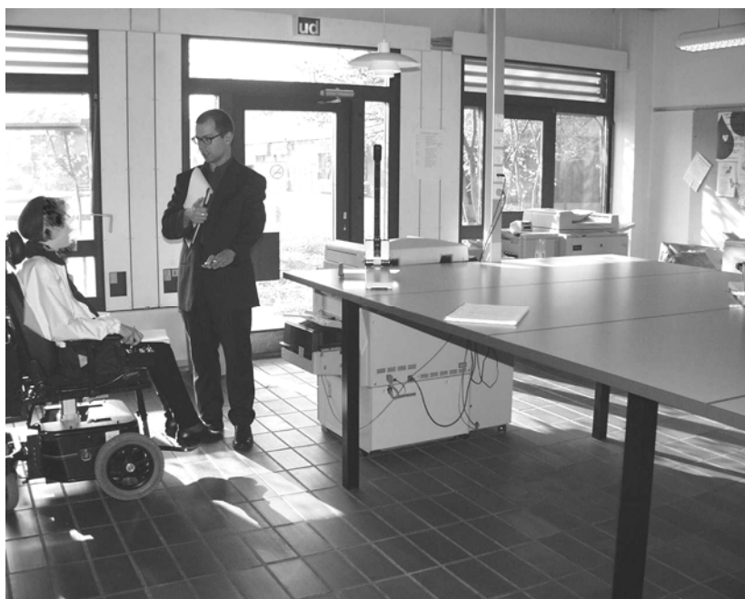
Illustration 9 Studentercentrets kopirum