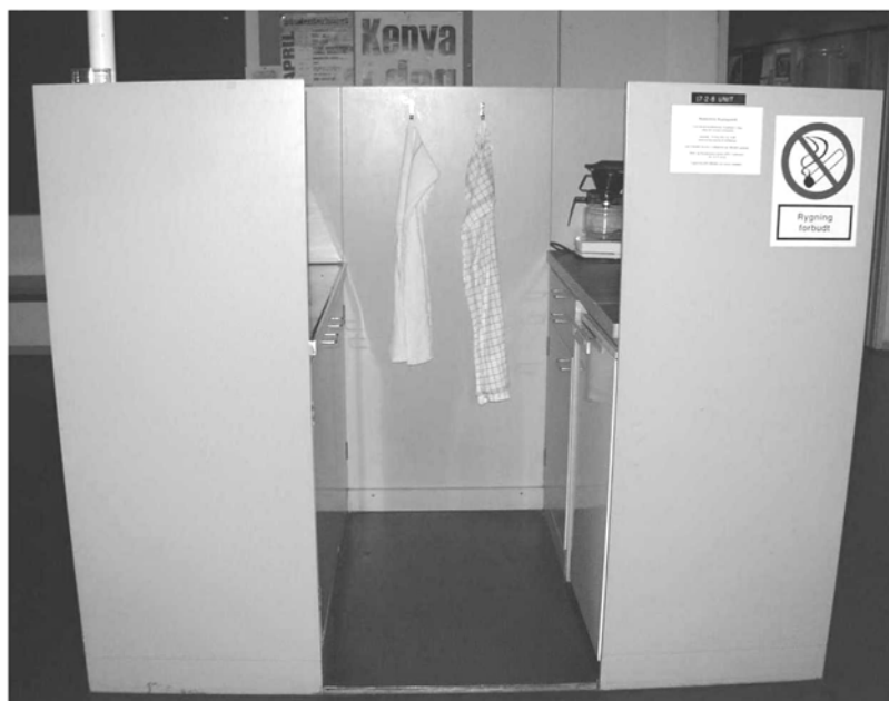
Illustration 23 Original opholdskrog med originalt tekøkkenmodul