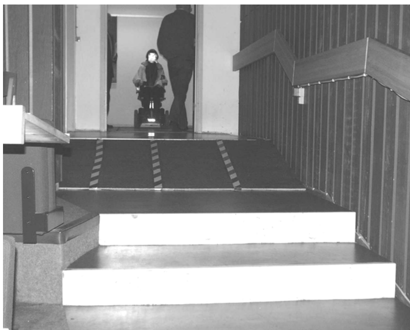
Illustration 11 Rampe i Lille Auditorium