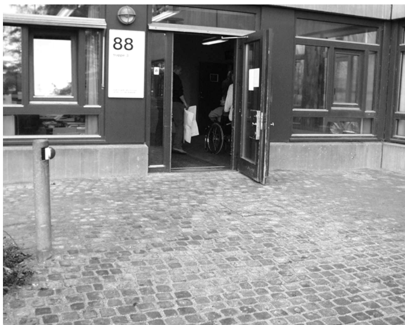
Illustration 7 Indgang 88