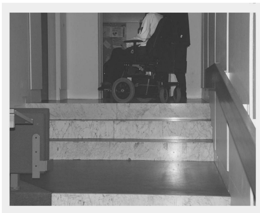
Illustration 5 Reposer i Store Auditorium