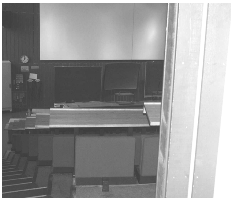
Illustration 12 Udsyn for kørestolsbruger i Lille Auditorium