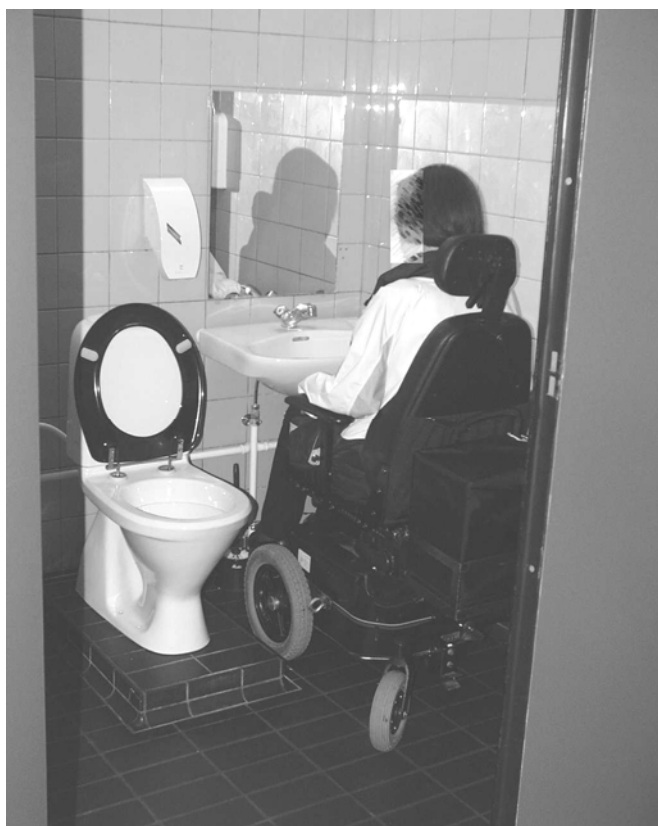
Illustration 3 Handicaptolet