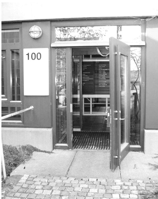
Illustration 10 Indgang 100