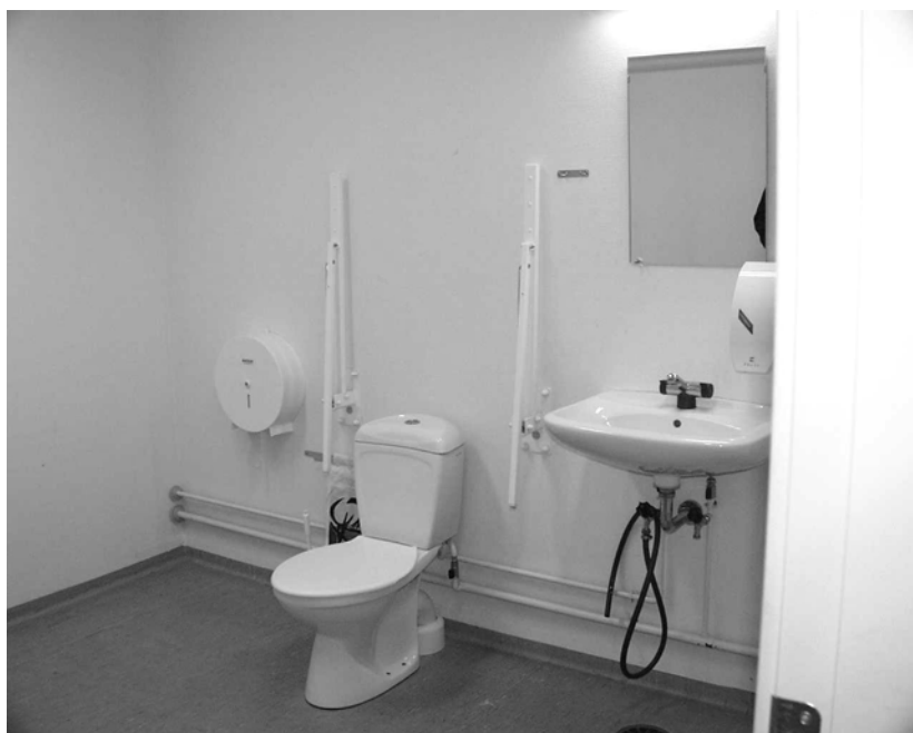
Illustration 17 Handicaptolet ved pavillon P1-2