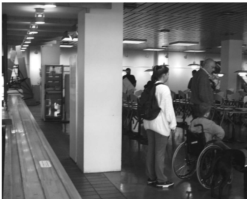
Illustration 2 Engelskkantinen