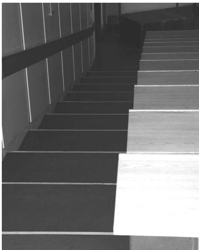
Illustration 6 Trappe i Store Auditorium