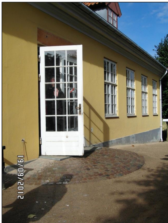
Fig. 4 - Indgangen til butikken

Indgangsdøren er placeret så højt, at det har været nødvendigt at lave en halvcirkelformet "rampe" af brosten.