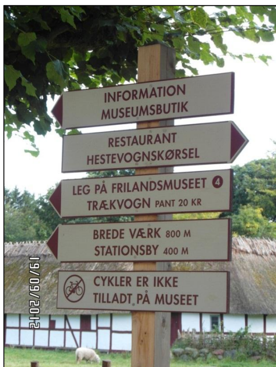
Fig. 2 – Skiltestander med det "manglende" skilt, der skulle have informeret om adgangsvejen for kørestolsbrugere til restauranten og handicappedtoiletet

Et yderligere skilt på standen (afbildet på fotoet nedenfor), der skulle have vist vej til bagindgangen til restauranten (gennem restaurantens have og op ad en grusbelagt rampe), var tilsyneladende blevet flyttet/nedtaget kort tid før inspektionen.