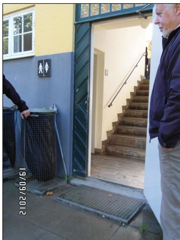
Fig. 13 – De udvendige adgangsforhold til toiletterne

Disse forhold kan gøre det vanskeligt for visse kørestols- og rollatorbrugere at komme ind på toilettet ad denne vej. Jeg henstiller til Frilandsmuseet at overveje, på hvilken måde problemet kan løses, og beder om underretning om, hvad min henstilling fører til.