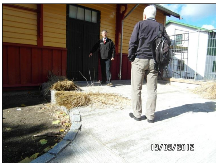
Fig. 10 – Rampe til teatersalen

Det iværksatte arbejde inkluderer også toiletter og handicaptoiletter.