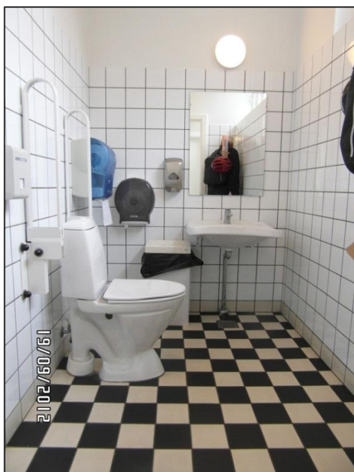
Fig. 1 – Handicappedtoiletet uden for restauranten

Et yderligere skilt på standen (afbildet på fotoet nedenfor), der skulle have vist vej til bagindgangen til restauranten (gennem restaurantens have og op ad en grusbelagt rampe), var tilsyneladende blevet flyttet/nedtaget kort tid før inspektionen.