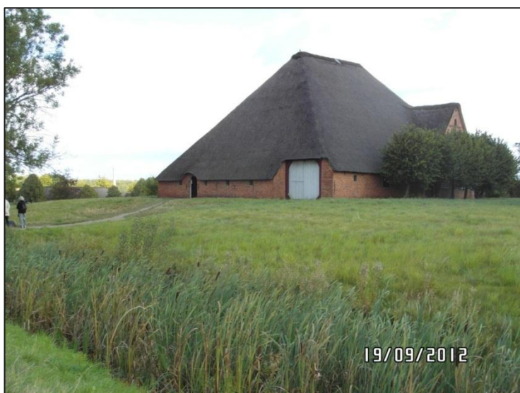
Fig. 9 – Adgangsforhold til gården fra Ejderstedt

Opkørslen til gården, der ligger på et såkaldt "værft" til beskyttelse mod oversvømmning, er ikke særlig stejl. De besøgende har imidlertid gennem årene trampet en (relativt dyb) sti op til indgangen, hvilket gør adgangen sværere for kørestolsbrugere og gangbesværede.