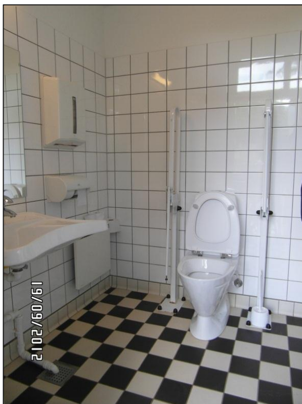
Fig. 14 – Handicaptollet beliggende ved den centrale spiseplads

Handicaptollet i forbindelse med Frilandsmuseets centrale spiseplads (der ligger ved siden af Gård fra Ostenfeld, Sydslesvig, kortets pkt. 4) opfylder stort set alle de ovenfor nævnte krav. Nedløbet fra håndvasken er f.eks. rykket helt ind til væggen, således at en kørestolsbruger, der ønsker at benytte håndvasken fra sin kørestol, kan komme ind under vasken.