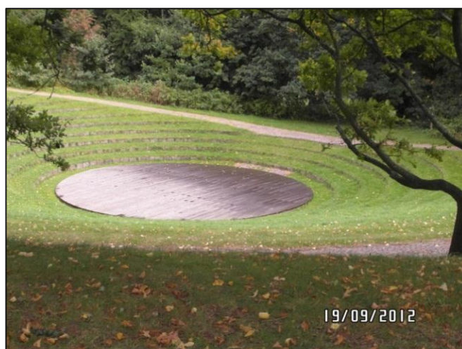
Fig. 16 - Festpladsen

Stierne ned mod festpladsen er imidlertid belagt med brosten, og belægningen er endvidere meget ujævn.