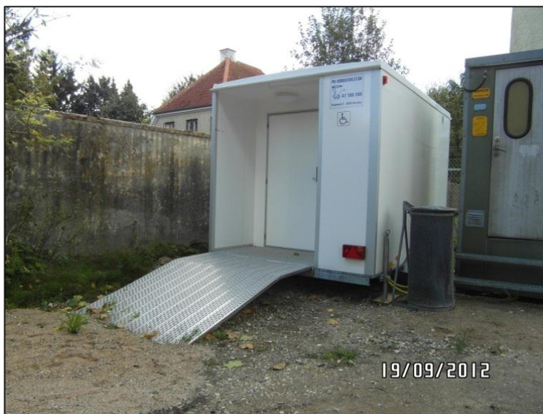
Fig. 15 – Det mobile (handicap)toilet

Som allerede nævnt var der på inspektionstidspunktet opstillet et mobilt (handicap)toilet til brug for de besøgende til teatersalen i stationsbyen.