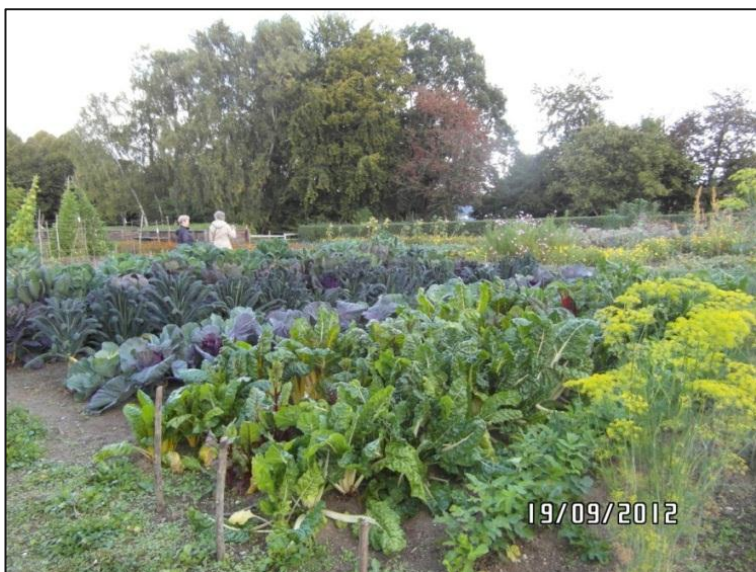
Fig. 7 – Haven ved hovedgården fra Fjellerup

Der var (næsten) fuld adgang til haven til Fjellerup Hovedgård for kørestolsbrugere – og også til dyrene i hønsehuset.