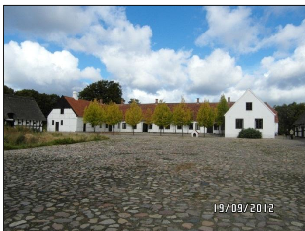
Fig. 6 – Gårdspladsen ved hovedgården fra Fjellerup

Denne gård er efter det oplyste en typisk dansk hovedgård (gårdens ældste del er fra 1400-tallet). Hovedgården har en kæmpe gårdsplads belagt med (runde) sten.