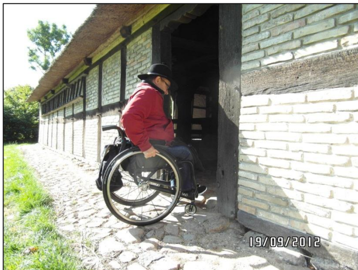
Fig. 5 – Adgangen til gården fra Ostenfeld

Gården, der er fra 1600-tallet, ligger lige over for den centrale spiseplads. Dørtrinnet kunne ikke forceres med en kørestol uden (en lille smule) hjælp.