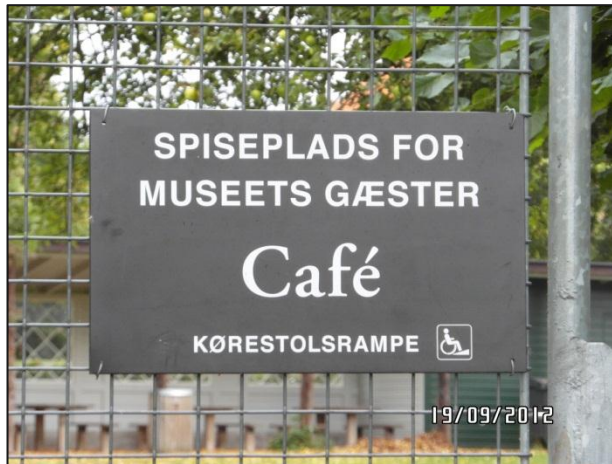
Fig. 3 – Orienteringsskiltet ved indgangen til restaurantens have

Der var således på inspektionstidspunktet først et skilt ved indgangen til haven.