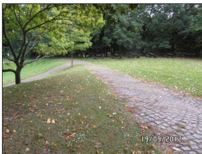
Fig. 17 – Belægningen på sti ned mod festpladsen

Stierne ned mod festpladsen er imidlertid belagt med brosten, og belægningen er endvidere meget ujævn.