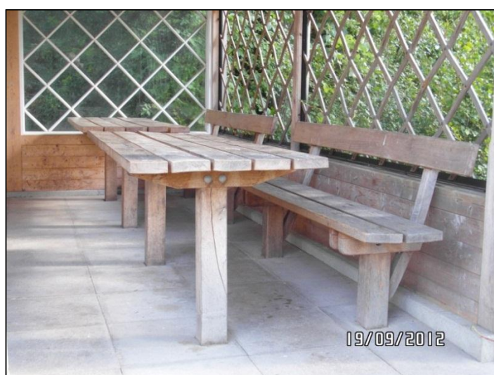
Fig. 11 – Borde ved spisepladsen

Som anført på hjemmesiden findes der på den centrale spiseplads udover et velegnet handicaptoilet også en række borde specielt egnede til kørestolsbrugere.