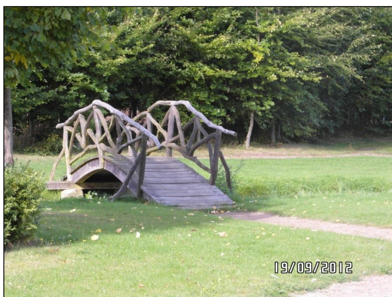
Fig. 8 – Træbro over vandløb

Dette lille forbehold skyldes de (buede) træbroer over vandløbene i haven.