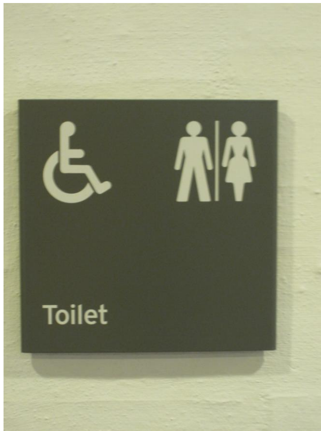
Illustration 8 – Skilt til (handicap)toilettet

Efter min opfattelse er den højre side af skiltet mere retvisende end den venstre. Toiletet kan således bedst beskrives som et helt almindeligt toilet i overstørrelse. Jeg henviser til at toilettet – bortset fra rummets størrelse og det forhold at der er god plads ved siden af toiletkummen – helt savner de faciliteter som gør rummet egnet for kørestolsbrugere. Jeg sigter f.eks. til armstøtter, hævet toiletkumme og muligheden for at benytte håndvasken siddende på toilettet. Jeg bemærker at listen langt fra er udtømmende.