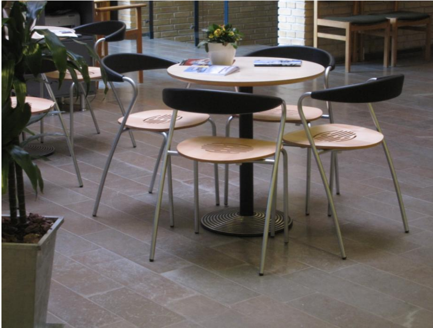
Illustration 6 – Venteområdet i Borgerservice

Bordene vil på grund af udformningen, med kun ét ben og uden sarg, også kunne bruges af kørestolsbrugere.