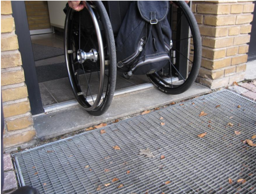
Illustration 3 - Gitterristen

Min medarbejder og jeg målte ikke gitterristens dimensioner, men på baggrund af de fotografier som blev taget under inspektionen for at støtte hukommelsen, synes gitterristen foran indgangspartiet ikke umiddelbart at kunne give anledning til problemer. For en ordens skyld beder jeg dog om kommunens bemærkninger også på dette punkt.