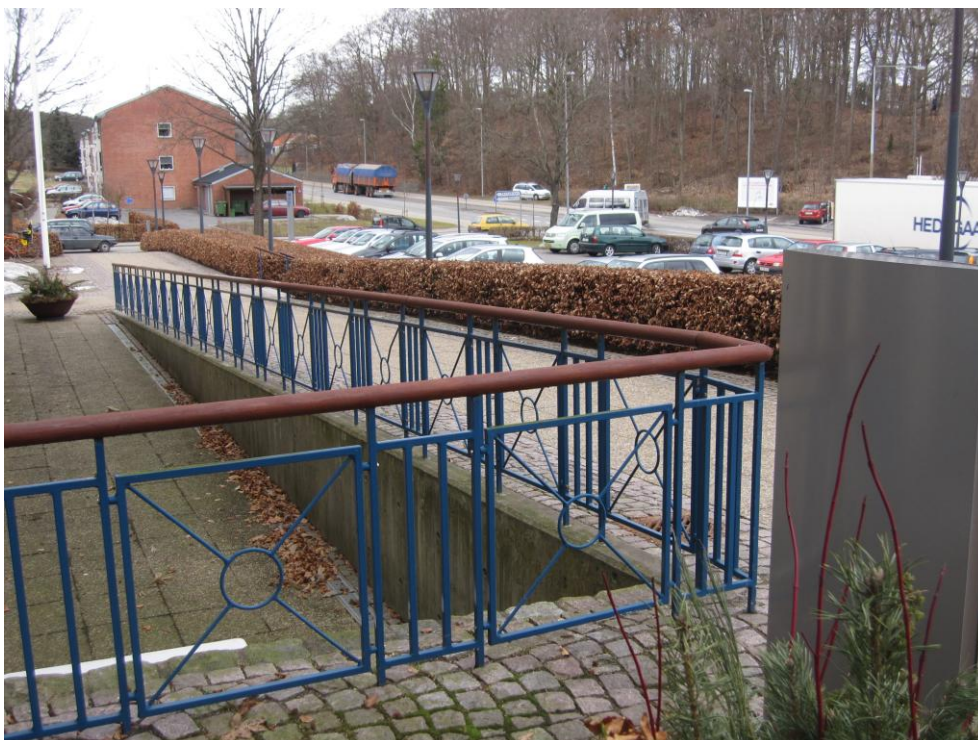
Illustration 1 – Rampe op til indgangen

Fra vejen/fortovet fører som allerede nævnt en bred rampe frem til indgangsdøren. Rampen, der er bygget ind i terrænet, er i to dele med en stor repos midtpå.