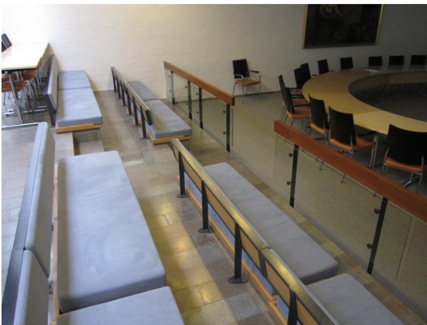
Illustration 7 – Byrådssalen

Byrådssalen er, som det fremgår af illustrationen nedenfor, traditionelt opbygget (som et teater).