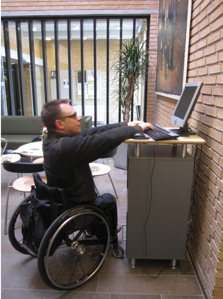
Illustration 5 – Pc til borgernes afbenyttelse

Der var pc'er til rådighed for borgere der foretrækker dette, men maskinerne var placeret i en højde som gør dette tilbud irrelevant for kørestolsbrugere.