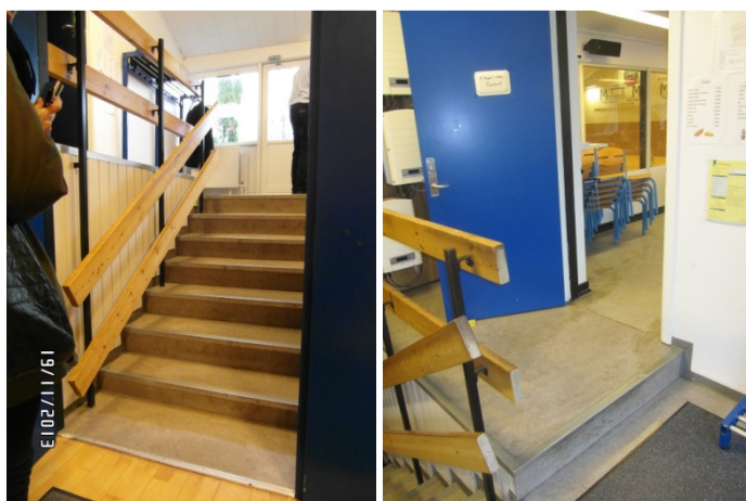
Adgangsvej til faciliteter for valgstyrelere og tilforordnede.

Lokalerne til brug for valgstyrelere og tilforordnede var placeret i idræts- og kulturcentrets kantine ved siden af toiletterne. Det var således nødvendigt at passere adskillige trapper for at nå til kantine. Der var desuden en indgang fra den modsatte side af bygningen, men også her var der niveauforskel i form af en forhøjning om en trappe, hvorfor det ikke var muligt for en kørestolsbruger at benytte indgangen på egen hånd.