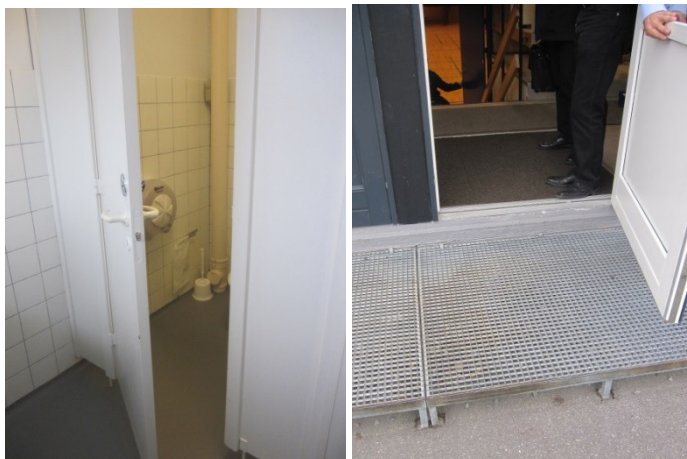
Toiletfaciliteter og bagindgang.

Toiletterne var opdelt i båse. Døren til selve toilettet var 58,5 cm bred.