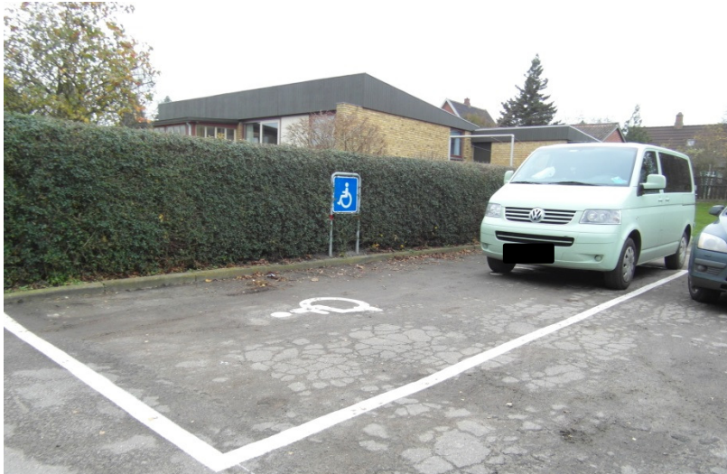
Handicapparkering, Nordfalster Idræts- og Kulturcenter.

I den foreløbige rapport bad jeg Guldborgsund Kommune om at sikre, at der blev etableret handicapparkeringspladser i overensstemmelse med reglerne, såfremt kommunen har i sinde at benytte hallen som valgsted ved et fremtidigt valg.