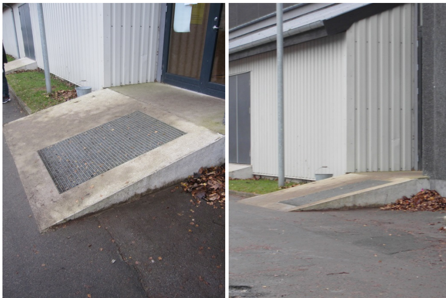
Rampe ved indgangsparti, Nordfalster Idræts- og Kulturcenter.

Ved hovedindgangen til hallen var etableret en rampe. Besøgsholdet fik under inspektionen oplyst, at hallen blev bygget for omkring 5-6 år siden, og at rampen blev etableret i den forbindelse. Rampen var 1,99 m lang og målte 35 cm på det højeste sted. Rampen havde således en hældningsprocent på 17,6 (1:5,7). Der var en rist på den ene side af rampen. Øverst på rampen var etableret en repos umiddelbart inden indgangsdøren. Indgangsdørene åbnede udad og fyldte i åben stand hele repos'en. Der var ingen taktil afmærkning ved indgangen.