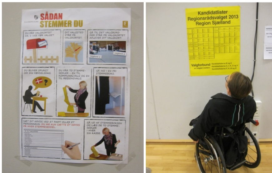
Plakat "Sådan stemmer du" og kandidatlistor.

I den foreløbige rapport bad jeg Guldborgsund Kommune om at overveje, hvordan kommunen i fremtiden sikrede, at kandidatlistor og andet informationsmateriale kunne læses af alle vælgere. Jeg bad kommunen om at oplyse mig nærmere om disse overvejelser.