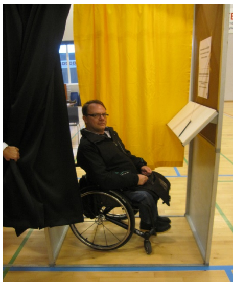
Særligt indrettet stemmerum.

Besøgsholdet erfarede på valgdagen, at der var etableret et særligt indrettet stemmerum. Stemmerummet målte 80 cm i dybden og 1,26 m i bredden. I rummet var opsat en bordplade i en højde af 97 cm. Selve bordpladen var opsat på skrå og derfor kun 22 cm dyb. Der var ikke plads til, at fødder og fodstøtter kunne stikke ud under stemmerummets væg.