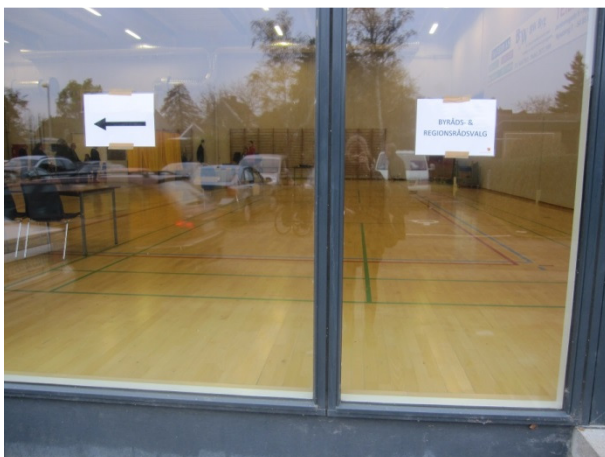
Skiltning Nordfalster Idræts- og Kulturcenter.

På udearealerne foran afstemningsstedet var der ikke opsat skilte med angivelse af, hvor valget fandt sted. Der var dog på glaspartiet ind til selve hallen opsat enkelte små skilte med teksten ”byråds- & regionsrådsvalg” efterfulgt af et skilt med en pil med angivelse af retning.