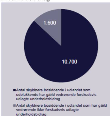
Figur 2: Status for skyldnere med gæld vedrørende ikke-forskudsvis udlagte underholdsbidrag